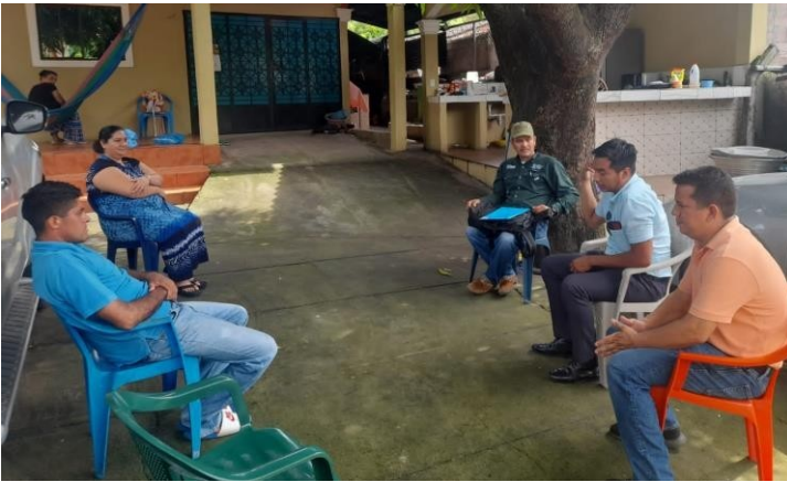
Equipo investigador reunido con miembros de APROE El Jocotal.