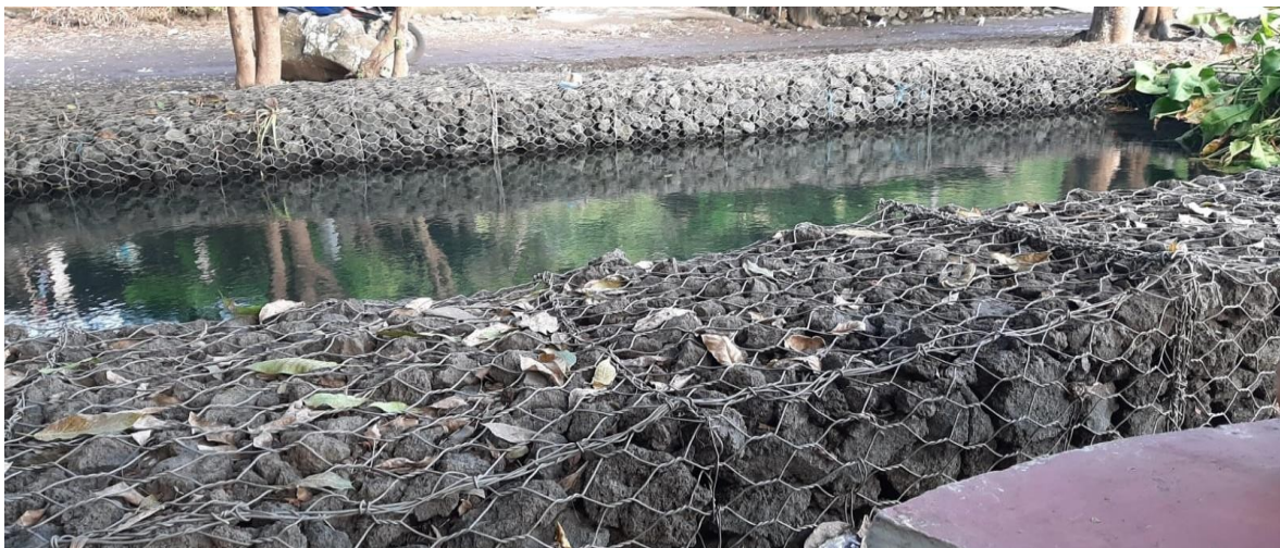
Muros de contención