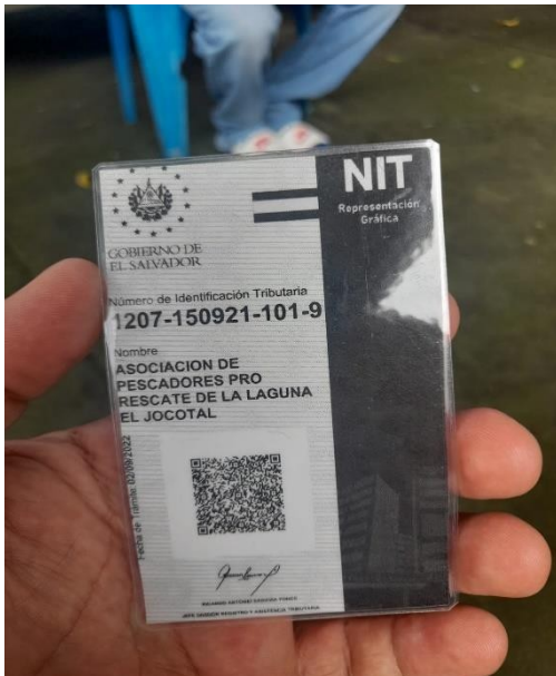
NIT de ASPRO El Jocotal el cual lo obtuvieron posterior de constituirse jurídicamente.