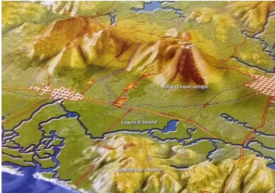
Figura 1: Mapa de ubicación de la laguna El Jocotal.