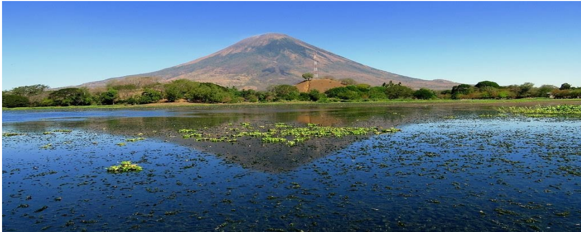
Vista panorámica de la Laguna El Jocotal