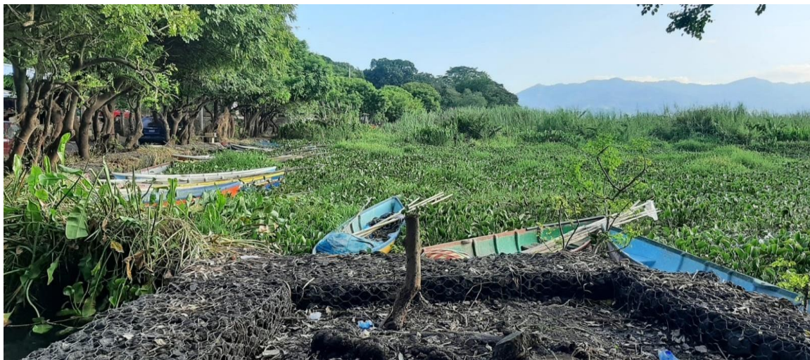
Contorno de La Laguna